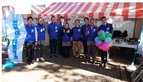
渋谷くみんの広場

歯の衛生週間では区との共催で「よい歯のつどい」が開催され、毎年何万人も集まる「渋谷くみんの広場」では、会のブースにはたくさんの方が訪れます。