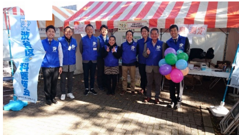
ふるさと渋谷フェスティバル

歯の衛生週間では区との共催で「よい歯のつどい」が開催され、毎年何万人も集まる「ふるさと渋谷フェスティバル」では、会のブースにも多い年で1000人以上の方が訪れます。